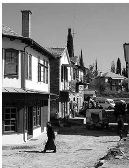
Karyes, hlavní město Mnišského státu Athos, kde se sice neplatí daně, ale musíte být mnichem.

Tato praxe se mnoha politikům EU zdá neslučitelná s „rovností“. Jak je možné