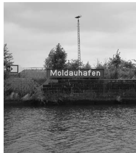
Vjezd do Moldauhafen.

Od zahájení pronájmu v roce 1929 dalo Československo svobodný přístav do podnájmu Československé plavební společnosti labské, a.s. Tato společnost provozovala jak přístav, tak vodní dopravu po labské vodní cestě. Firma metitím prošla znárodněním v roce 1949 a privatizací v roce 1992. V důsledku úbytku zakázek