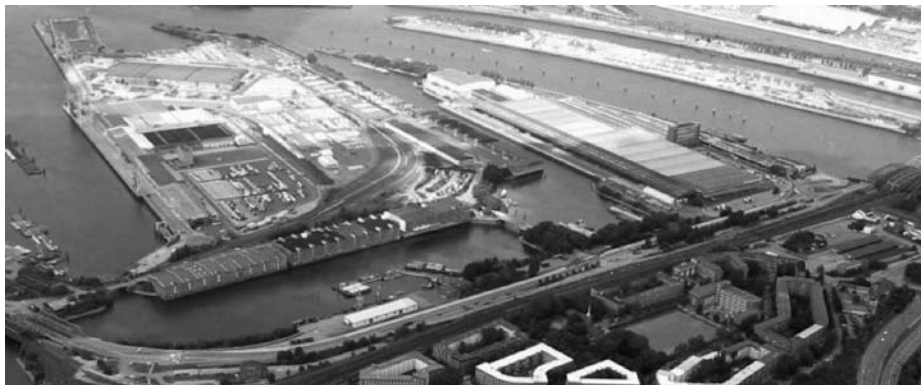
Pohled na Moldauhafen.

Po první světové válce získalo Československo na základě Versailleské smlouvy do extrateritoriálního pronájmu na 99 let část německého území v oblasti Svobodného hanzovního města Hamburku. Na mapě Hamburku dostalo místo jméno Moldauhafen (Vltavský přístav) a Prager Ufer (Pražské nábřeží).