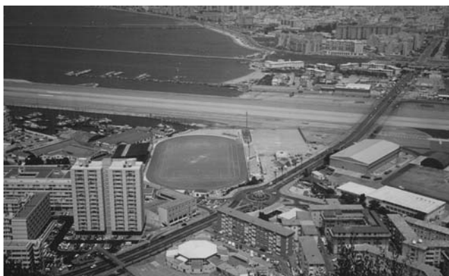
Když na Gibraltarů přistávají letadla, auta musí stát na červenou

Ústava schválená v roce 1969 byla jedním z nejdůležitějších mezníků, které vydláždily cestu Gibraltarů k větší samo-