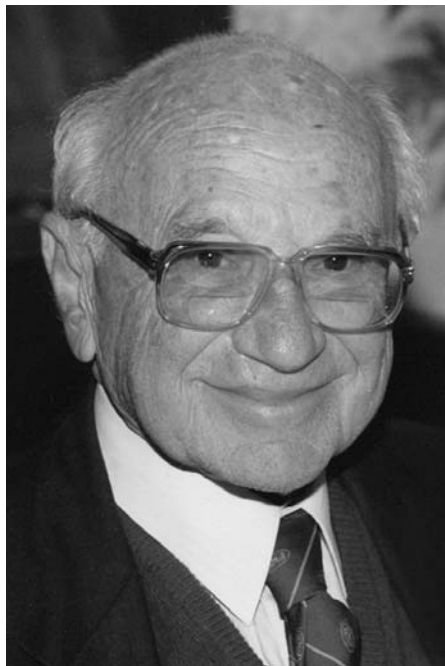
Milton Friedman (1912–2006)

Milton Friedman se narodil roku 1912 v New Yorku v rodině přistěhovalců z Podkarpatské Rusi. V roce 1933 vystudoval ekonomii na Chicagské univerzitě, kde byl později v šedesátých a sedmdesátých letech profesorem. On a další ekonomové udělali z Chicagské školy více než jen slavnou univerzitu – chicagská škola se stala názorovou a metodologickou platformou, která se stala významnou protiváhou socializujícím tendencím poloviny 20. století. Chicagští ekonomové obhajovali kapitalismus, soukromé vlastnictví a svobodnou tvorbu cen na trhu oproti socialistům všeho druhu, státnímu vlastnictví a cenovým regulacím. V roce 1976 získal Milton Friedman za svůj přínos ekonomické vědě Nobelovu cenu.