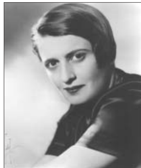
Fotografii poskytl Ayn Rand Institute ( www.aynrand.org ) Autor: Talbot, New York City 1943

Objektivismus Ayn Randové je unikátní koncept, založený na obhajobě existence objektivní reality a možnosti jejího poznání lidským rozumem. Jde vlastně o filozofii krajního individualismu a racionálního egoismu, která zdůrazňuje nezastupitelnou roli lidského rozumu jako jediného nástroje poznání a měřítka všech hodnot a tvrdí, že člověk a jeho život jsou samy sobě nejvyšší hodnotou i cílem. Objektivistická filozofie vášnivě obhazuje volnotržní kapitalismus jako nejpřirozenější a jediný spravedlivý společenský systém. Naproti tomu se tvrdě staví proti myšlenkám kolektivismu a altruismu, které považuje za počátek sebezáhubné cesty k socialismu. Stejně tak tvrdě kritizuje náboženské věrouky jako únik před realitou, vedoucí k další dějinné zhoubě, totiž iracionálnímu mysticismu. Teoretické i beletristické dílo Ayn Randové ohromuje svou silou, důsledností a průzračností. Její odkaz je tak stále nesmírně živý, svěží a inspirující.